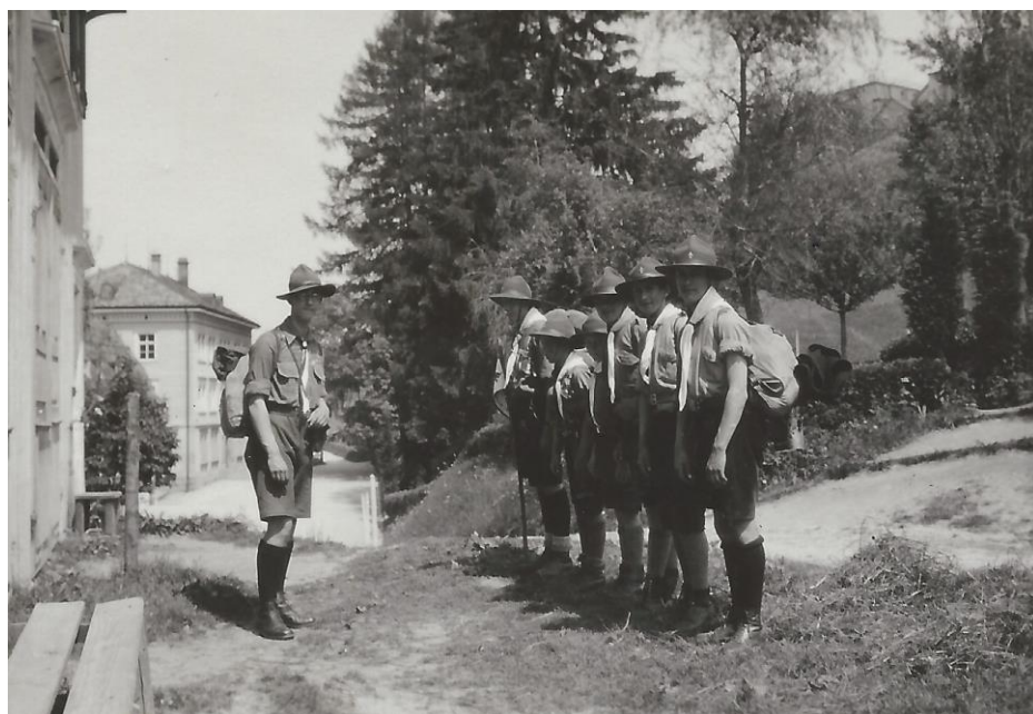
Bereit zur Pfingstwanderung 1929